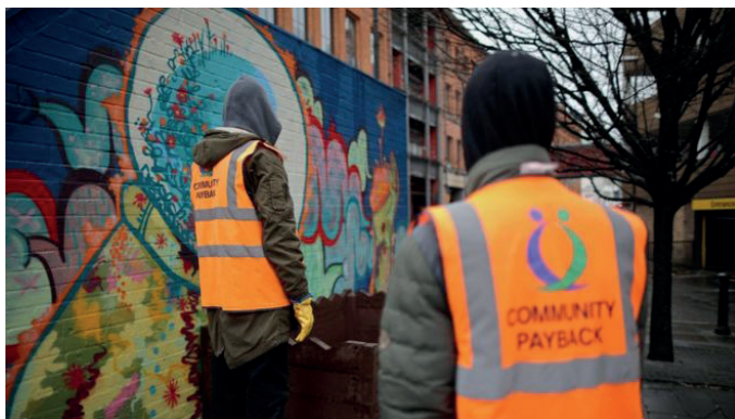
Slika br.1. Rad u javnom interesu (community payback) 24

dostojanstvo i zbog toga je bitno prisustvo lične saglasnosti za njenu primenu. 23 Naime, u nekim državama prestupnici tokom izvršenja ove kazne nose fluorescentne prsluke prilikom obavljanja poslova u svojoj zajednici (slika br.1). Ovakav način izvršenja se može tumačiti dvojako. Sa jedne strane kao nešto dobro jer se osuđenom licu daje do znanja da plaća za svoj prestup i da je to njegova kazna, a drugim ljudima se daje primer i šalje poruka da mogu za svoje prestupe odgovarati na takav način. Sa druge strane, nekada ovakav primer može biti negativan, u smislu obeležavanja i stigmatizovanja osuđenih lica naročito u manjim sredinama ili sredinama koje su specifičnog mentaliteta (koje su sklone predrasudama, stereotipima, stigmatizaciji, javnom odbacivanju i podsmevanju određenih pojedinaca ili grupa). Zato i ostaje pitanje za svakog okrivljenog da li će prihvatanjem ove kazne doći do ugrožavanja njegovog ličnog dostojanstva?